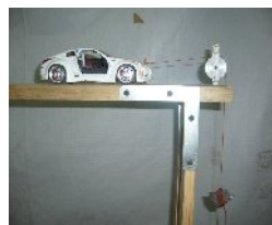
Figura 1 Prototipo en el cual se muestra el movimiento a aceleración constante